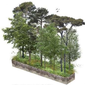
Couronne des forêts