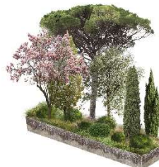
Les vergers et châteaux