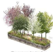
Couronne des jardins