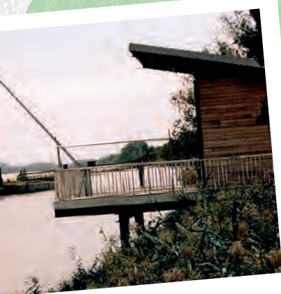
Construction de tôles et de bois sur pilotis du filet de pêche ou du poisson plat.