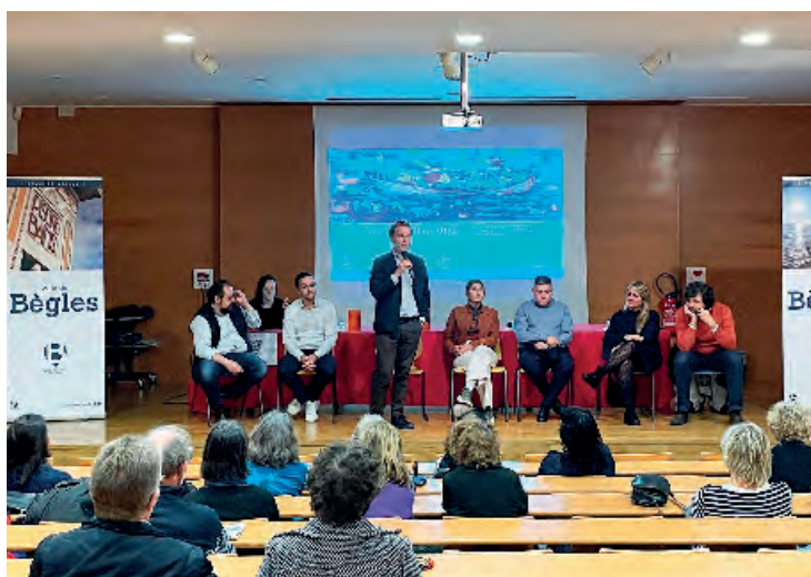
L'équipe municipale à la rencontre des Béglaïes et des Béglaïes. Quatre réunions publiques ont eu lieu dans les quartiers pour échanger sur la vie quotidienne à Bègles et les réalisations en cours et à venir d'ici 2026.