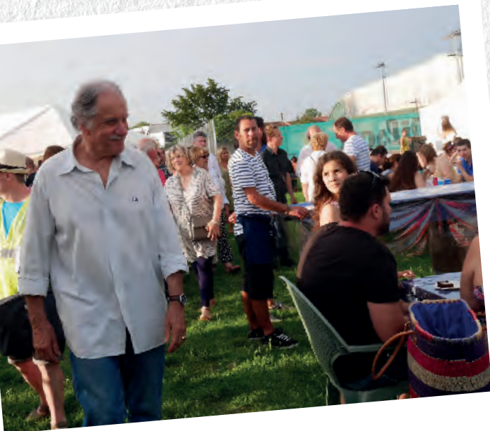
La Fête de la Morue 2017

Créée en 1996 par le député-maire Noël Mamère, à l'initiative de Bègles Perspectives Economie et de Pierre Bru, adjoint à l'économie et au commerce, la Fête de la Morue célèbre l'histoire de Bègles et les Béglaï-s fier-es de cet héritage morutier. D'abord organisée par les restaurants de la ville, avec tapas et verre de vin pour 10 francs de rue, cette grande fête populaire prend de l'ampleur. L'omel devient l'emblème de l'événement, qui déménage en 1997 au stade puis au stade Duhourquet en 1998. Les concours gastronomiques, le grand bal des morues ou encore le marché à la morue voient le jour. En 1999, la fête déménage à la plaine des sports puis ensuite en centre-ville, créant un véritable village de la Morue avec quarantaine de stands. En 2001, l'événement passe à 3 jours de festivités, et le concours de l'affiche est lancé l'année suivante. La première dictée maritime est organisée en 2004. Entre 2000 et 2019, la Fête de la Morue devient un rendez-vous incontournable. Après deux éditions à Bègles plage liées au Covid, en 2022, les Béglaï-s-es votent le retour en centre-ville. Avec 3 lieux : la place du Bicentenaire, le parc de la mairie et le parc de la Maison municipale de la musique.