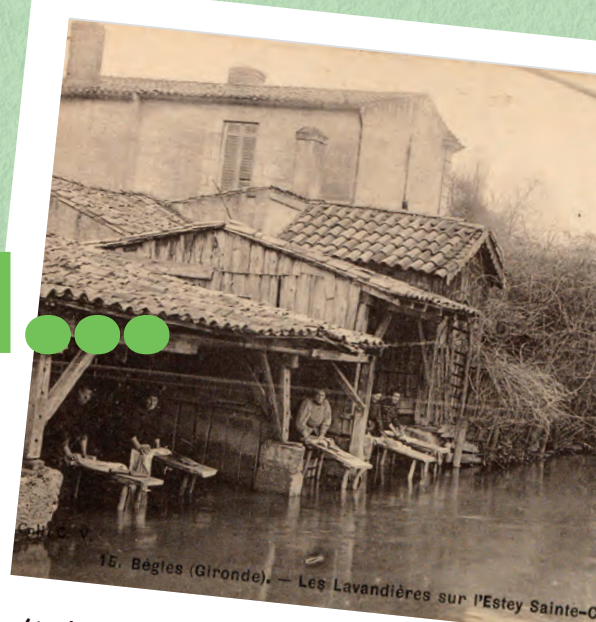
15. Bègles (Gironde). — Les Lavandières sur l'Estey Sainte-Croix, busé au sortir de la guerre.

L'histoire de Bègles est intimement liée à l'eau, marquée par les esteys qui sillonnaient la ville. La Garonne a joué un rôle clé dans son développement, favorisant des activités comme les sécheries de morue et la papeterie. Demain, le lien avec le fleuve sera renoué, ouvrant la voie à un avenir redessiné autour de cette richesse naturelle.