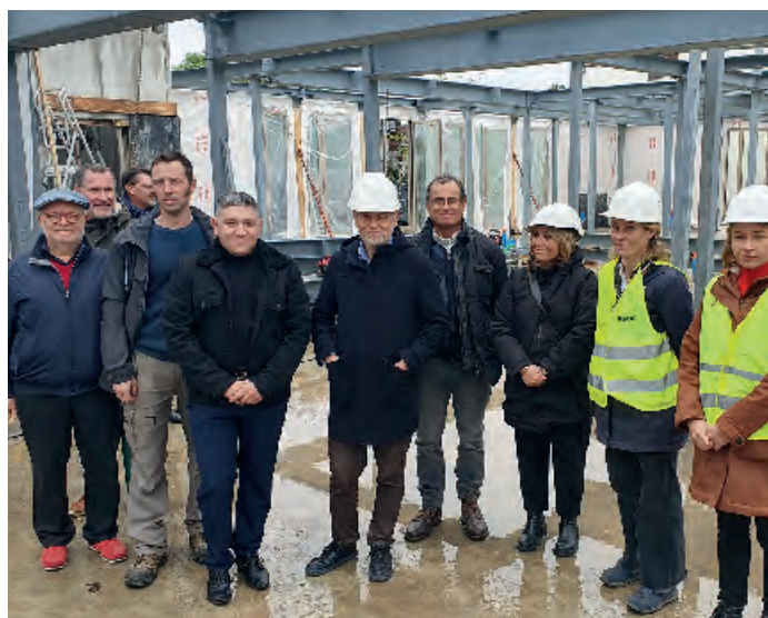
Futur groupe scolaire Jacques Prévert : lancement de chantier le 20 novembre. Ce bâtiment à haute ambition environnementale accueillera 7 classes maternelles et 10 classes élémentaires à la rentrée 2025.