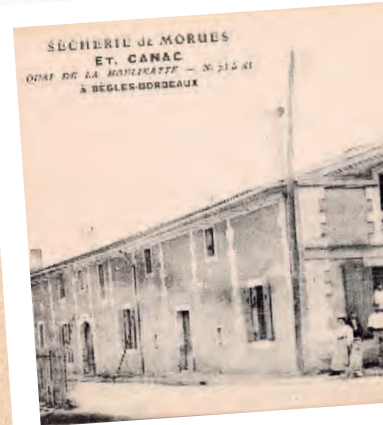
De nombreuses femmes travaillaient à la sécherie de morues, quai de la Moulinatte.

Un grand merci à l'association des timbrophiles béglais, à Claude Bignière et à Françoise pour leur prêt de photos et de documents.