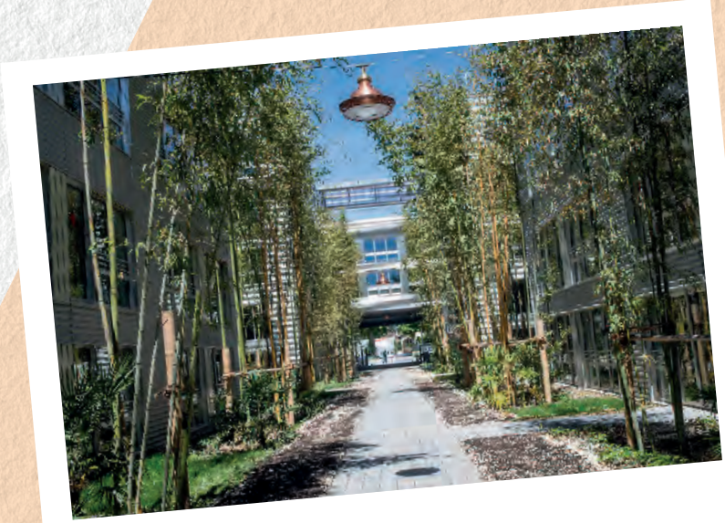
La cité Numérique

Le fleuve, la morue, le train et le rugby, ont fait Bègles au XX e siècle. S'appuyer sur l'histoire pour accueillir aussi bien les technologies que les habitants, tous nouveaux, c'est la force de notre ville.