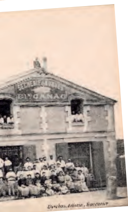
...ient dans les sécheries