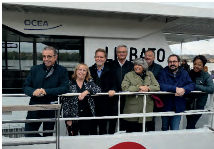
Inauguration le 7 novembre de la nouvelle ligne fluviale Bato 3 : Port de Bègles – Benauges. Vous pouvez désormais naviguer entre Bègles et la rive droite de Bordeaux.