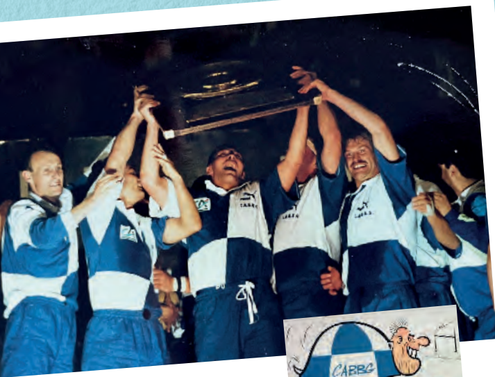
La victoire historique de Bègles en 1991