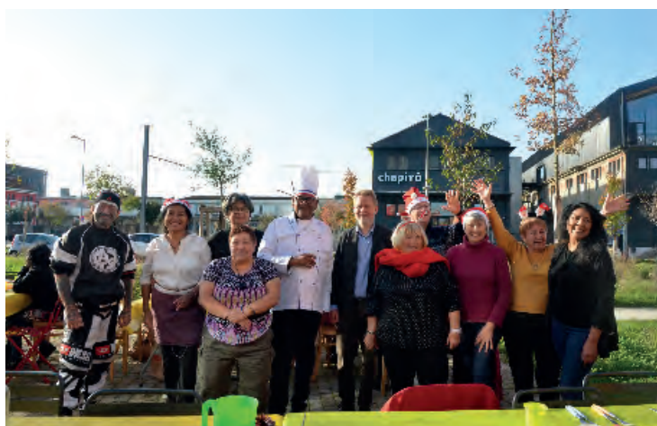
Ambiance festive dans le quartier Terres Neuves sous le soleil du 29 novembre. Repas partagé antillais pour la cinquantaine d'habitantes et de bénévoles participant à ce repas de fête.