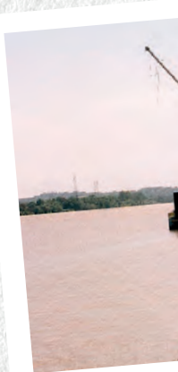
Cette petite course tire son nom de