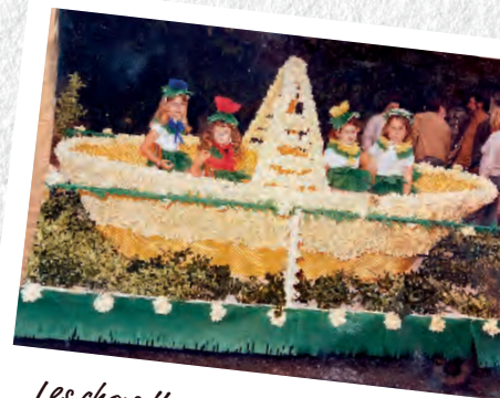
Les chars fleuris de Carnaval en 1974