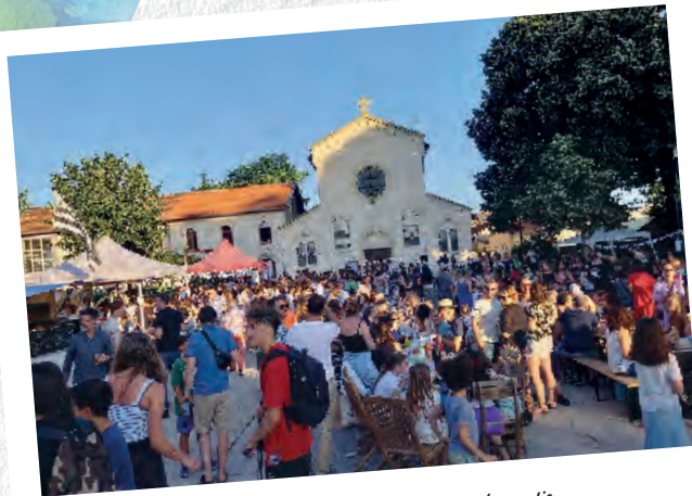
Les Béglaï-s-es et les Béglaï-s apprécient toujours les fêtes de quartier

La Fête de la Morue rassemble chaque année, les Béglaï-s-es de toutes les générations. Et chaque quartier, chaque rue sait se réunir pour des moments de partage et de beaux souvenirs collectifs.