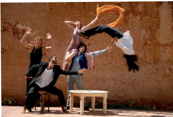
Cie CABAS

Danse, rap, humour, cirque, concerts-dessinés et ciné-concerts... La CitéCirque démarre sur les chapeaux de roues dès le 2 octobre , se poursuit jusqu'au 7 juin et vous entraîne tout au long de l'année de ChapitÔ, à l'Espace Jean Vautrin et au cinéma La Lanterne. Artistes itinérants, jeunes talents, collectifs débridés... 16 représentations jonglant avec toutes les disciplines du spectacle vivant sont programmées cette année pour les enfants et les familles et vous invitent à suivre les chemins de la fantaisie et de l'imaginaire.