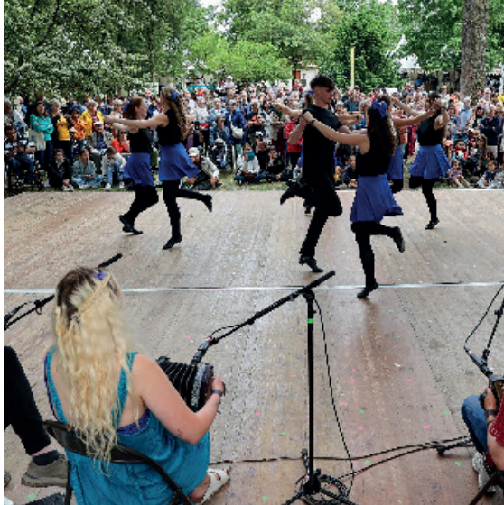
Fête de la Morue 2024