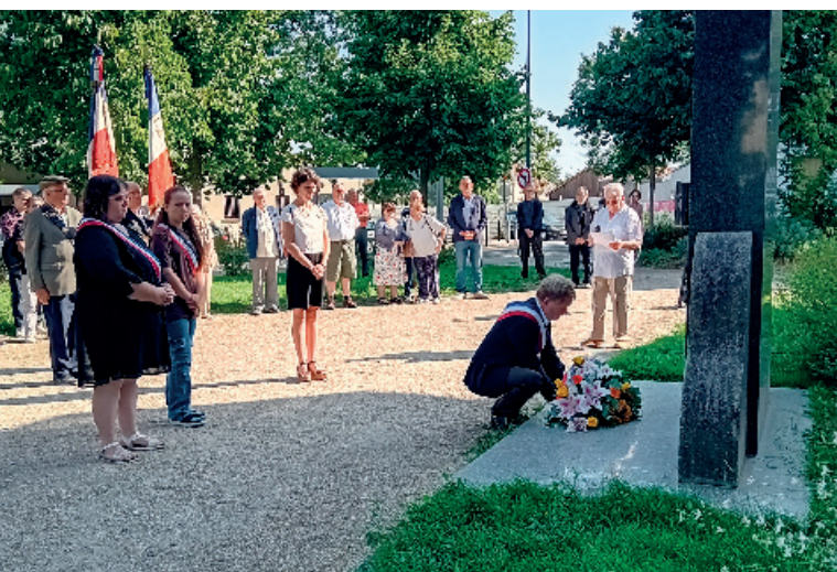
LES 80 ANS DE LA LIBÉRATION DE BÈGLES Le 26 août, Bègles fête les 80 ans de sa libération du régime de Vichy et de l'occupation nazie. La commune a payé un lourd tribut lors de la Seconde Guerre mondiale comme l'atteste le monument aux morts, en hommage aux résistantes bégloises dans le cimetière de Bègles.