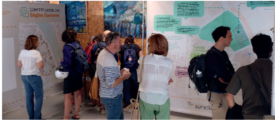
Le Forum des contributions organisé en octobre 2023 à Chapitô

Troisième grand territoire des projets urbains de l'EPA Bordeaux Euratlantique, le programme « Bègles Garonne » a donné une large place à la parole des Bèglaises et des Bèglais. Un premier plan guide et une feuille de route seront présentés le 19 septembre à la salle St-Maurice.