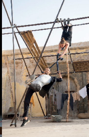
Cie CABAS