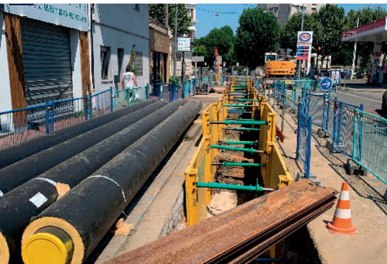
LES TRAVAUX POUR LE RÉSEAU CHALEUR Cet été, l'avenue Alexis Capelle et la rue des Châtaigniers ont connu d'importants travaux pour mettre en place un réseau de chaleur. Cette source de chaleur renouvelable est issue de l'unité de valorisation des déchets de Bègles (Valbom).