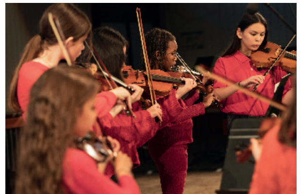
Maison Municipale de la Musique