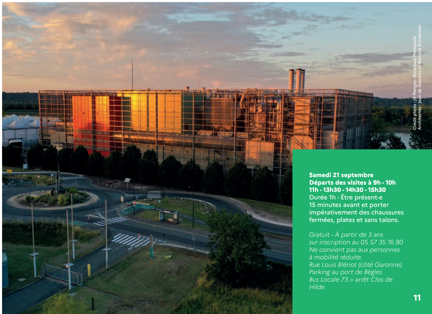
Crédit photo : JB Mengès - Bordeaux Métropole Architectes : Jean de Giacinto et Bernard Schweitzer

Samedi 21 septembre Départs des visites à 9h - 10h 11h - 13h30 - 14h30 - 15h30 Durée 1h - Être présent-e 15 minutes avant et porter impérativement des chaussures fermées, plates et sans talons.